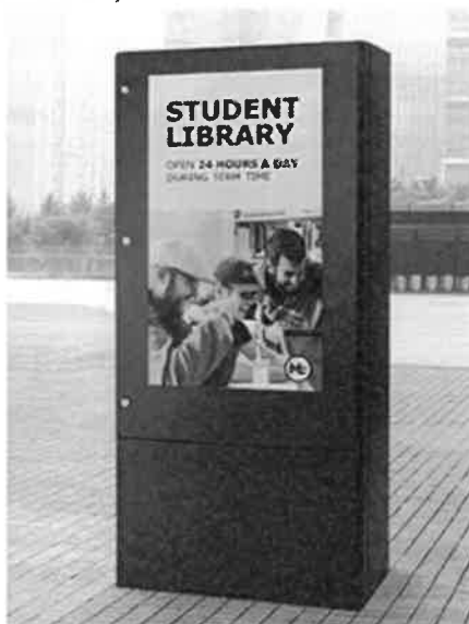
Figura 1 Imagine orientativă Avizier electronic interactiv exterior